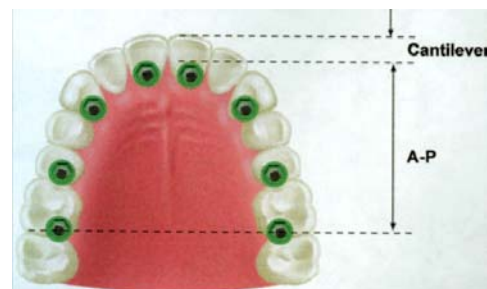
شکل ۲: حداکثر فاصله قدامی - خلفی مطلوب است