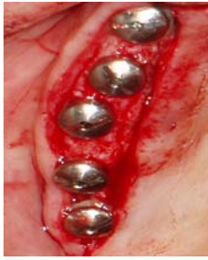
شکل ۳: ایمپلنت ها تا حد امکان نباید روی یک خط مستقیم باشند

پروتز موقتی که برای بارگذاری فوری ساخته شده نباید کانتی لور خلفی داشته باشد. چرا که کانتی لور خلفی از نظر زیبایی اهمیتى نداشته و به علت بالا بودن نیروهای جوشی در ناحیه خلفی اثر مخربى روی ایمپلنت ها خواهد گذاشت. به علاوه این پروتزهای موقت را باید با سمان دائم چسباند چرا که اگر سمان در قسمتی از پروتز از بین رود، کانتی لور به وجود خواهد آمد. (۲۹)