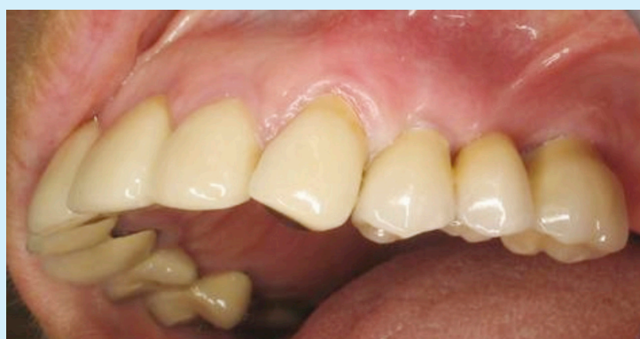
این همان بیمار صفحه قبل است اما پل در محل خود قرار گرفته است.